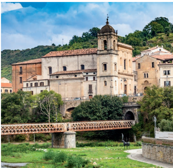
▲ Klasztor św. Franciszka z Paoli

nego Castello Normanno-Svevo (zamek normańsko-szwabski). Jego historia sięga początków XII w. i króla Rogera II, choć być może powiększył on tylko starszą twierdzę, jaka już wcześniej stała w tym miejscu. Zamek został zniszczony podczas katastrofalnego w skutkach trzęsienia ziemi w 1184 r., po czym odbudował go Fryderyk II, stąd obiekt bywa nazywany „zamkiem szwabskim”. Twierdza stała się później rezydencją Ludwika III Andegaweńskiego, króla Neapolu, a następnie przywrócono jej funkcję wojskową, czyniąc z niej jeden z najważniejszych punktów obronnych w Kalabrii. Historia zamku właściwie zakończyła się w XVII w., kiedy popadł w ruinę po kolejnym trzęsieniu ziemi. Dziś jest po prostu atrakcją turystyczną 📍 wt.–sb. 9.30–18.00, nd. 10.00–18.00; 4 EUR normalny, 2 EUR ulgowy.